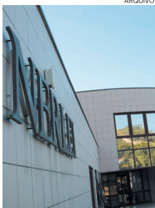
NERLEI é a Associação Empresarial da Região de Leiria

A Nerlei faz saber que o programa pretende promover o empreendedorismo, a criação de empresas e o autoemprego, apoiar a criação de pequenos projectos de investimento enquadrados por iniciativas de apoio ao empreendedorismo e à criação de novos empregos, nomeadamente na estruturação do projecto, mitigação de